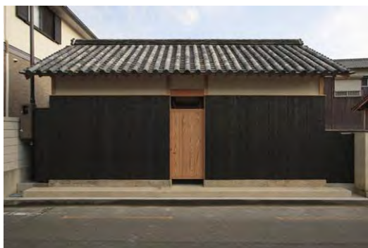
家プロジェクト「暮会所」 Art House Project "Gokaisho"