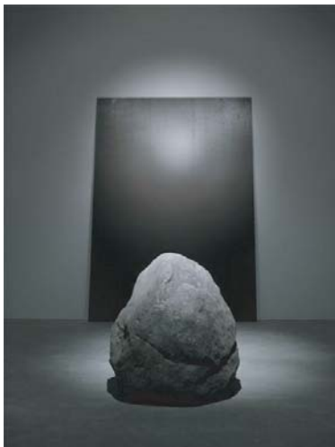
李禹煥「関係項 - 沈黙」(2010)

なお、ご参加いただく場合は、お手数ですが、別紙にてご連絡をくださいますようお願いいたします。 敬具