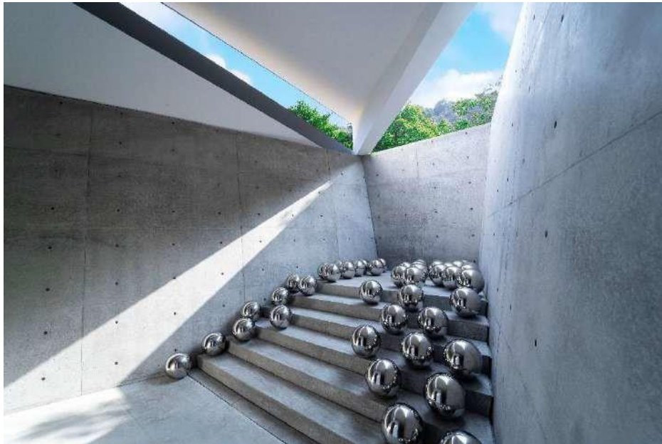
ヴァレーギャラリー展示作品「ナルシスの庭」

ベネッセアートサイト直島にて、2022年3月12日（土）に2つの新ギャラリーがオープン 安藤忠雄の9つ目の建築、草間彌生、小沢剛の作品などによる「ヴァレーギャラリー」 杉本博司の多様な作品群を本格的に鑑賞できる「杉本博司ギャラリー 時の回廊」