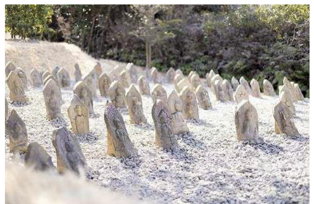
ヴァレーギャラリー展示作品 スラグブツダ88