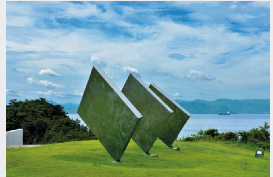
ジョージ・リックイー「三枚の正方形」1972-82 年 George Rickey, Three Squares Vertical Diagonal , 1972-82

When a Benesse staff member at the time visited his studio located in the mountains among a forest, Rickey