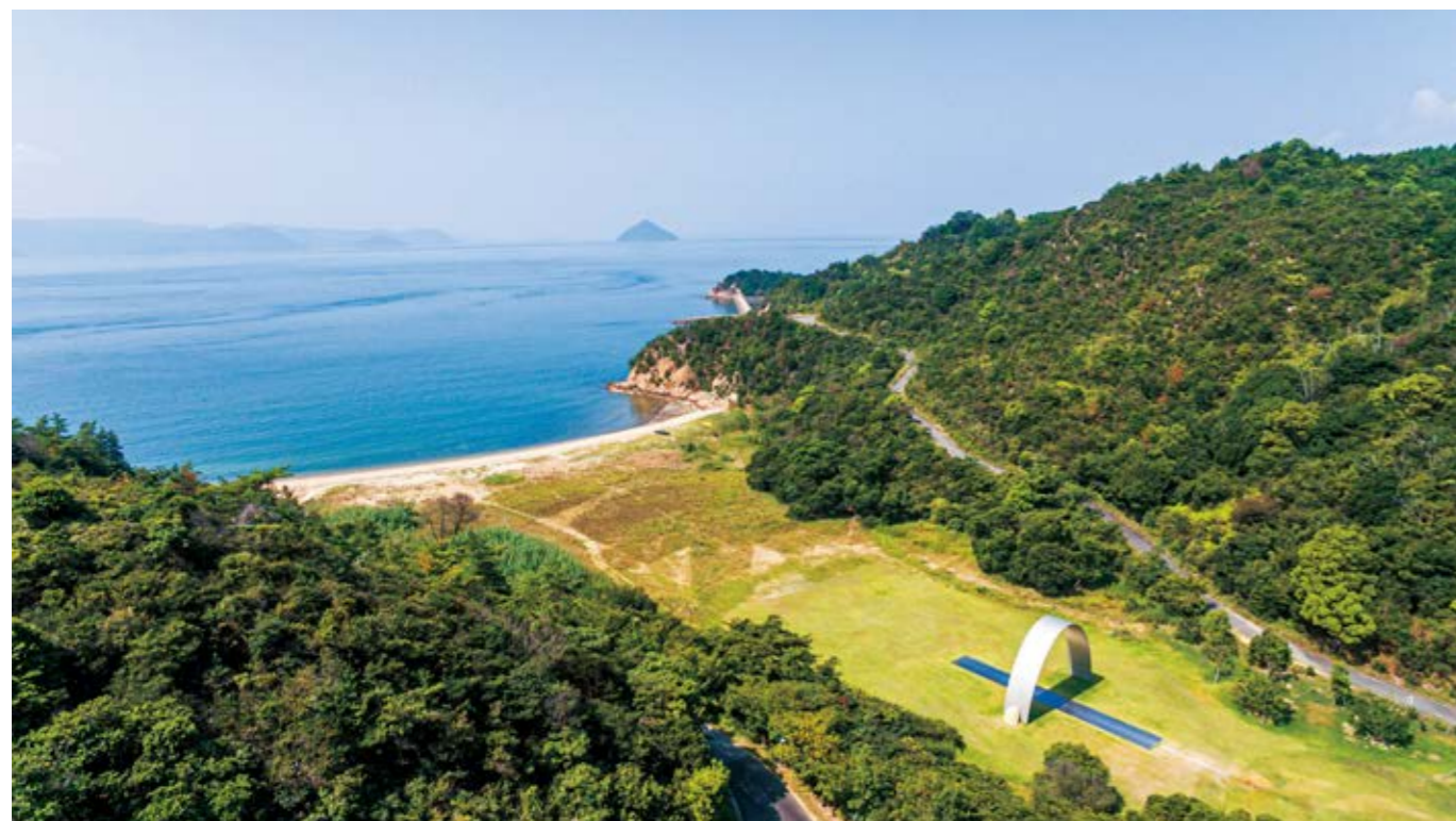
倉浦の谷間の地形と李禹煥の「無限門」。山から鼻に挟まれた谷が浦へと続く場所。(2020年8月 景観記録写真より) The form of the valley of Kuraura and Porte vers l'infini , facing the beach between the two capes (August 2020, the photo archive of the Project)

Porte vers l'infini is located at one end of a valley surrounded by slopes and a beach. Quietly embedded in the back end of the small valley is the museum designed by Tadao Ando. This area in Naoshima is called Kuraura. When you go out of the structure of the museum and walk