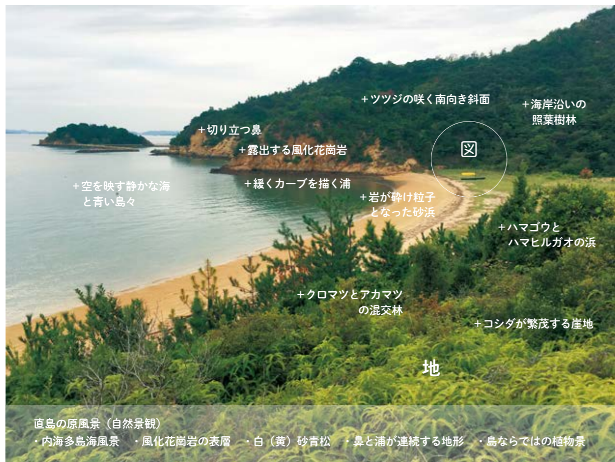
「地」の要素分解による直島の原風景再定義作業の資料より(2019年6月 作成: 鎌田あきこ)

From the documents regarding the redefinition of archetypal Naoshima landscape based on the component elements of the ‘ground’ (written by Akiko Kamata, June 2019)