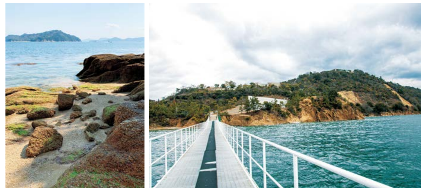
左：風化花崗岩とマサ土の砂浜。岩も土も浜も同じ種類の鉱物粒子で出来ている。(2019年3月) 右：ベネッセハウス ミュージアム前の棧橋からのビュー。荒々しい岩肌と植生。青い茶碗の作品「茶のめ」への視界の確保は必須。(2021年2月 景観記録写真より)

Left: Sandy beach constituted by eroded granite and decomposed granite. All of the rocks, soil, and sands here are composed of the same mineral particles (March 2019) Right: Landscape showing rocky cliffs and vegetation in front of Benesse House Museum. Drink a Cup of Tea must be always be in sight (February 2021, the photo archive of the Project)