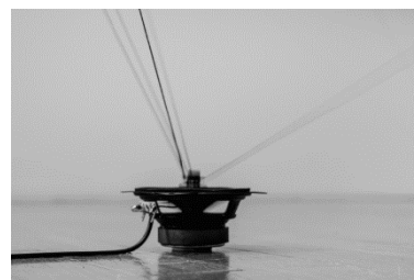
ズル・マハムード 《静粛なる抵抗宣言》2024