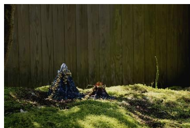
「Ring of Fire - ヤンの太陽&ウィーラセタクンの月」(昼のプログラム) 屋外展示風景 (一部)