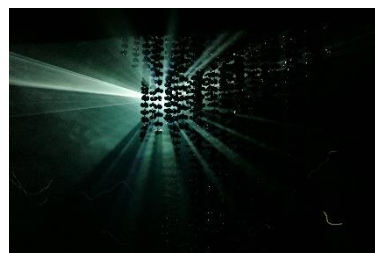
「Ring of Fire - ヤンの太陽&ウィーラセタクンの月」(夜のプログラム) 展示風景