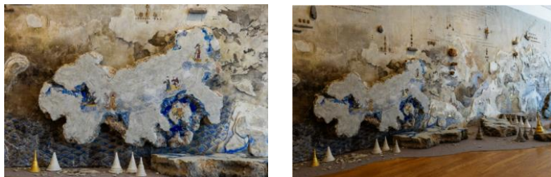
パナパン・ヨドマニー 《Aftermath》 2016