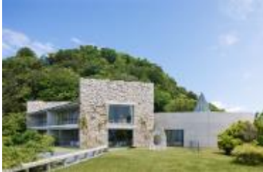
ベネッセハウス ミュージアム