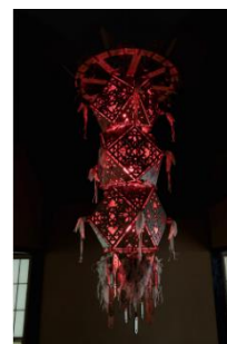
「Ring of Fire - ヤンの太陽&ウィーラセタクンの月」(昼のプログラム) 展示風景