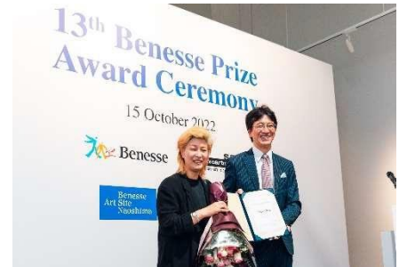
第 13 回(2022 年)ベネッセ賞授賞式の様子

「ベネッセ賞」は 1995 年、「福武書店」から「ベネッセコーポレーション」への社名変更を契機に、傑出したアーティストのアート活動を評価し、ベネッセグループの企業理念である「Benesse = よく生きる」を体現するアーティストを支援する目的で、ヴェネツィア・ビエンナーレにおいてスタートしました。「第11回ベネッセ賞（2016年）」からはその拠点をアジアに移し、シンガポール美術館と共催でシンガポール・ビエンナーレの公式賞として再始動しました。