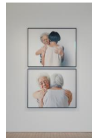
アマンダ・ヘン 《Always by my side》2023